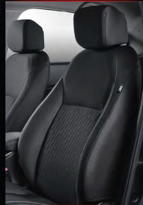
> Fabric Trimmed Seats with Side Bolster