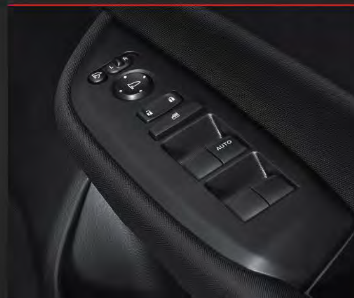
Door Switch Panel