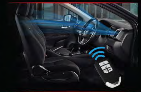
> Remote Engine Start