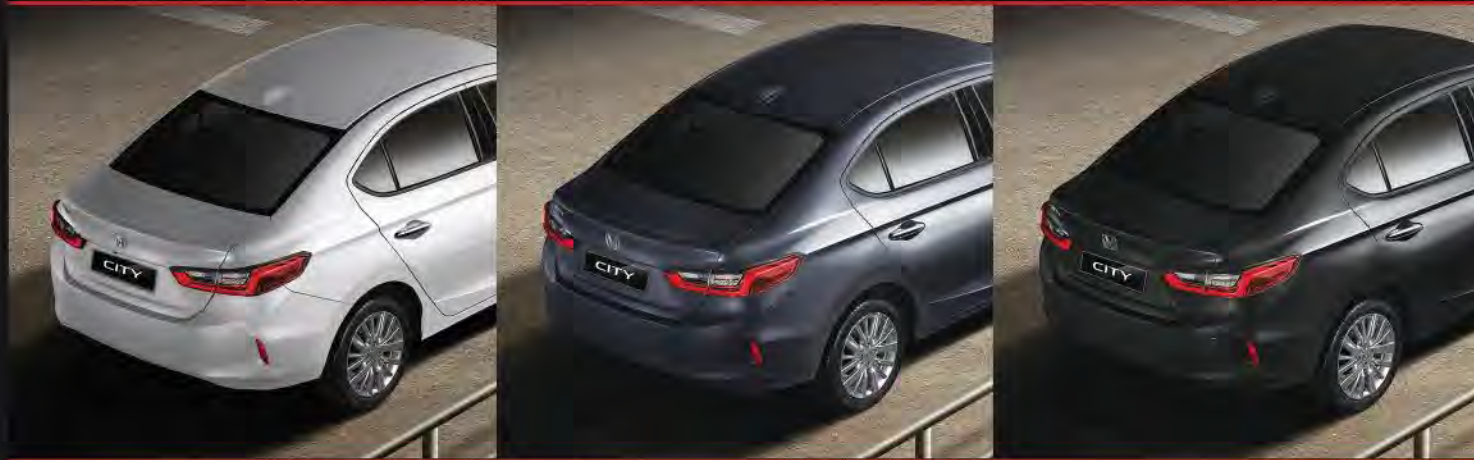
Platinum White Pearl