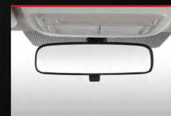
Day/Night Rear View Mirror