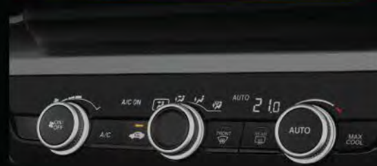
> Auto A/C