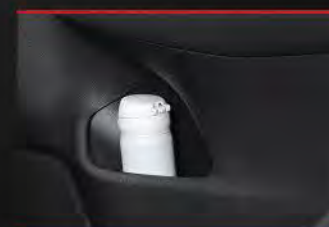
1 st & 2 nd Row Door Pocket