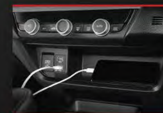
1 st Row USB Port 1 st & 2 nd Row Power Outlet