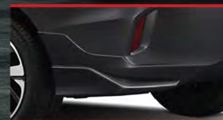
Rear Under Spoiler