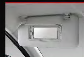
Sun Visor with Vanity Mirror