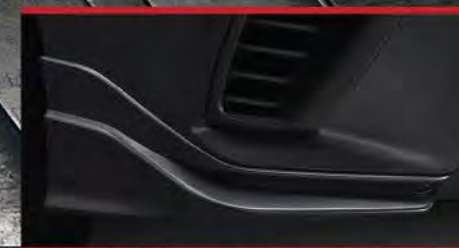
Front Under Spoiler