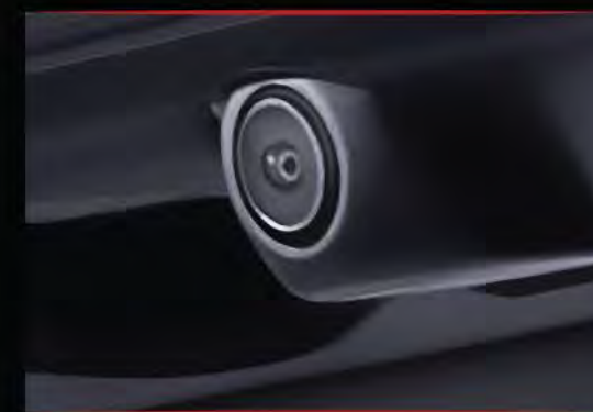
> Multi-Angle Rearview Camera

/ 8-Speakers / Cruise Control / Audio Steering Switch