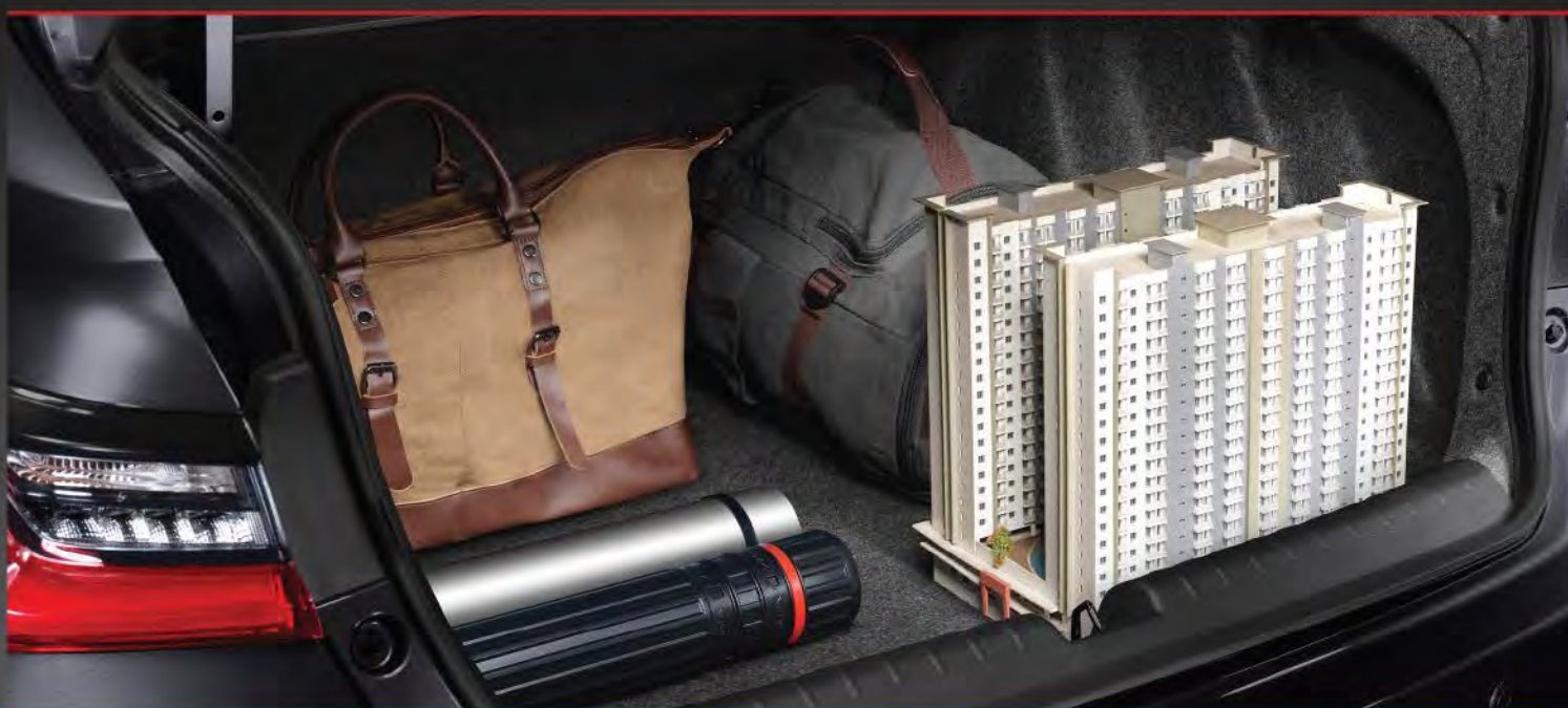
> Large Cargo Space

Bersama All New Honda City, kenyamanan dan kemudahan berbalut tampilan elegan yang pasti diandalkan setiap hari.