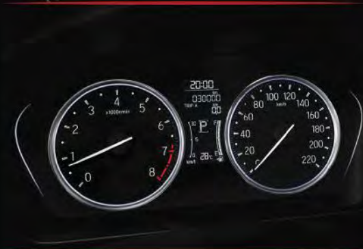
> Modern Meter Cluster